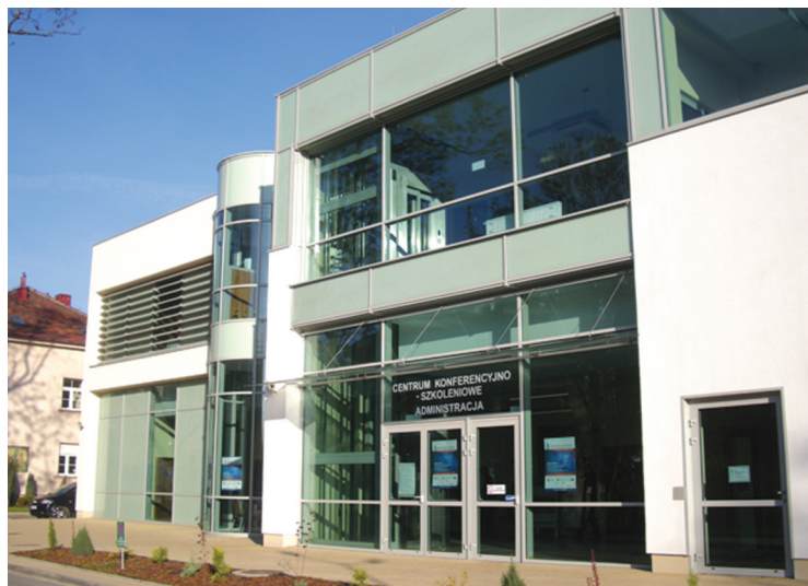
Na zdjęciu: nowoczesny budynek konferencyjno - administracyjny Szpitala – inwestycja dofinansowana ze środków UE

13:45-14:30 HEPATOLOGIA – Czy można się wyleczyć z wirusowego zapalenia wątroby typu B?